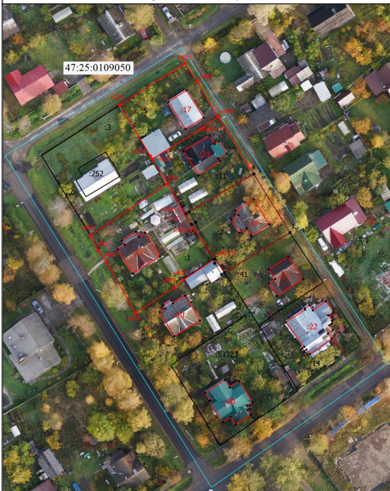
Схема границ земельных участков