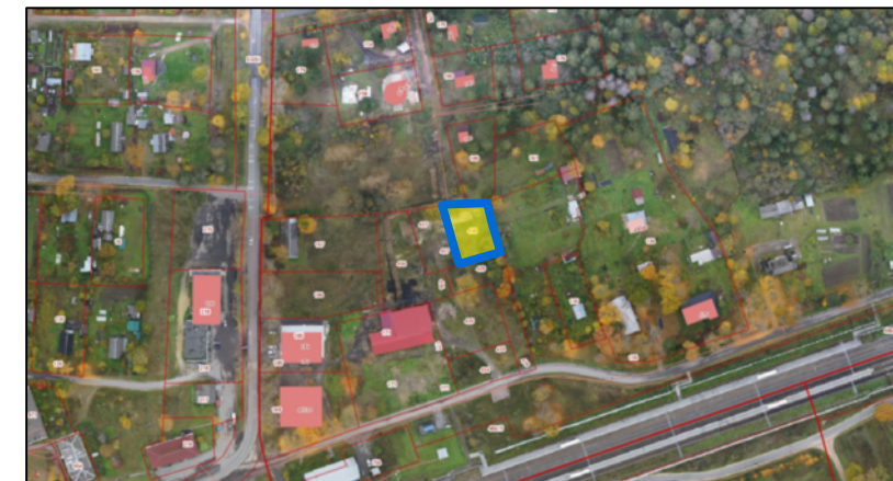
— место расположения земельного участка

СХЕМА РАСПОЛОЖЕНИЯ ЗЕМЕЛЬНОГО УЧАСТКА В ОКРУЖЕНИИ СМЕЖНО РАСПОЛОЖЕННЫХ ЗЕМЕЛЬНЫХ УЧАСТКОВ (СИТУАЦИОННЫЙ ПЛАН) М 1:5 000