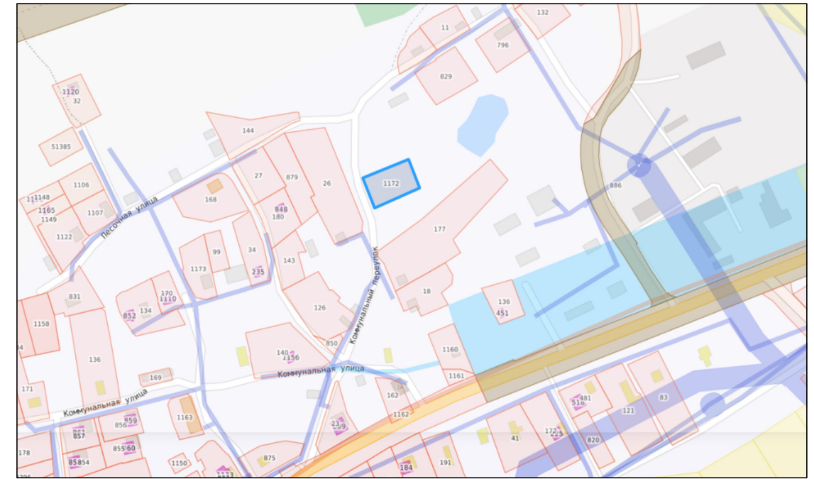
— место расположения земельного участка